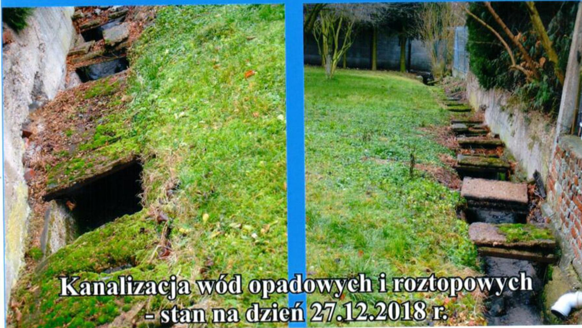
Kanalizacja wód opadowych i roztopowych - stan na dzień 27.12.2018 r.