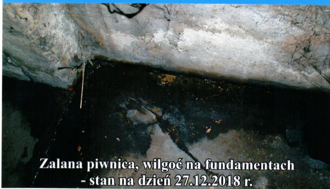
Zalana piwnica, wilgoć na fundamentach - stan na dzień 27.12.2018 r.