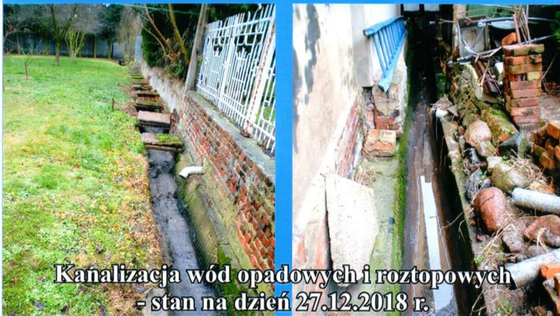
Kanalizacja wód opadowych i roztopowych - stan na dzień 27.12.2018 r.