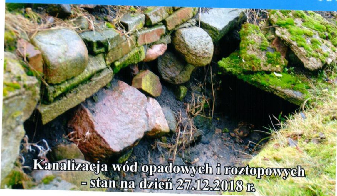
Kanalizacja wód opadowych i roztopowych - stan na dzień 27.12.2018 r.