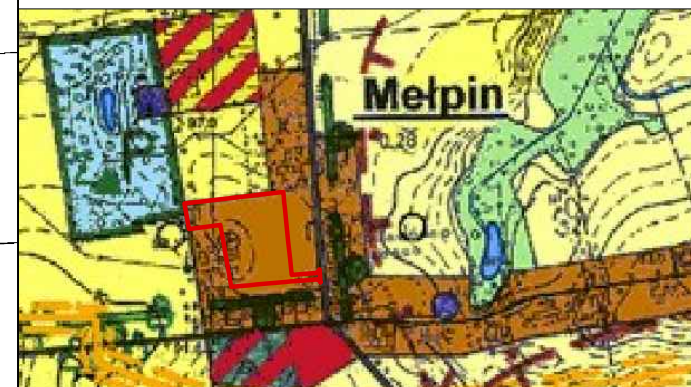
TEREN OBJĘTY PROJEKTEM MIEJSCOWEGO PLANU ZAGOSPODAROWANIA PRZESTRZENNEGO

WYRYS ZE STUDYUM UWARUNKOWAŃ I KIERUNKÓW ZAGOSPODAROWANIA PRZESTRZENNEGO MIASTA I GMINY DOLSK SKALA 1:10 000