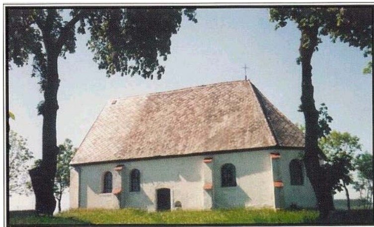
Rys. 4. Kościół św. Wawrzyńca z 1685 r. w Dolsku.