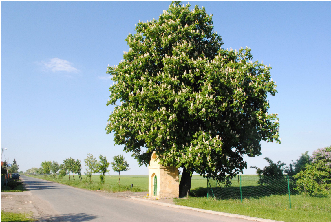
Masłowo (droga do Wieszczyzna)