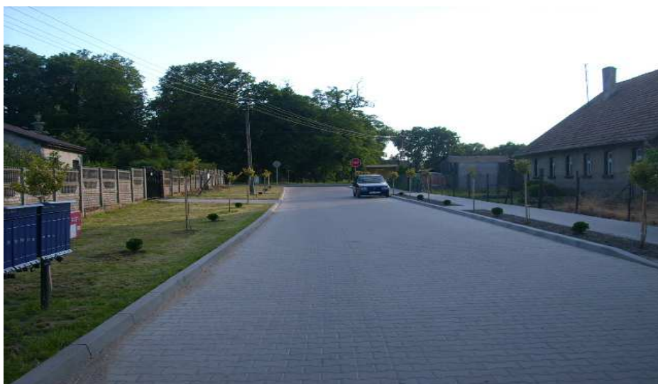
Czworak w wiosce (pierwszy budynek po prawej stronie)

Z czasów przebywania w Nowcu Florentyny Parczewskiej pochodzi dworek z XIX w z przyległymi do niego oborą, stodołą (1881) i stajnią-obora (1877) - wszystko położone w otoczeniu parku krajobrazowego z okazem lipy drobnolistnej. Z tego okresu zachowały się do dziś czworaki z 2 połowy XIX wieku i cmentarz ewangelicki, a raczej jego pozostałości. Usytuowany jest na skraju lasu przy drodze do leśniczówki Włóściejewki.