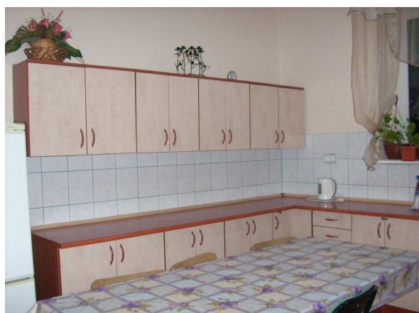
Zaplecze kuchenne w świetlicy