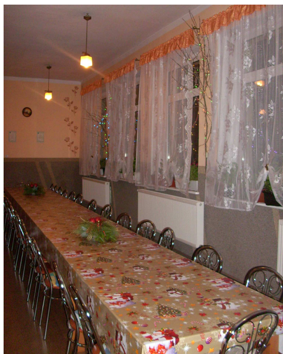
Świetlica po przeprowadzonych remontach