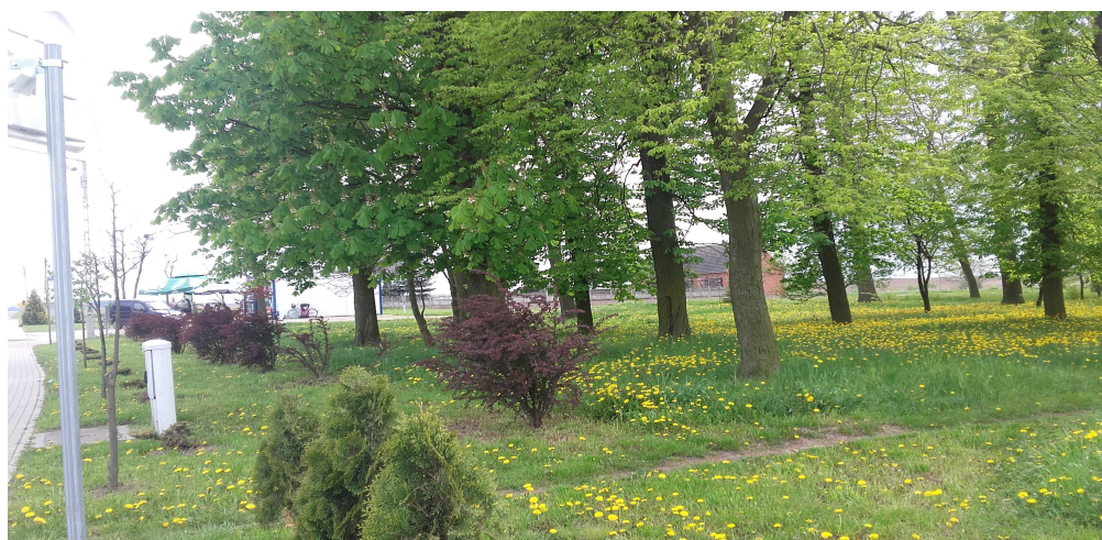
Park z nowymi nasadzeniami