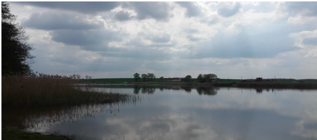
Jezioro Błazejewskie od strony Nowieczka z plażą