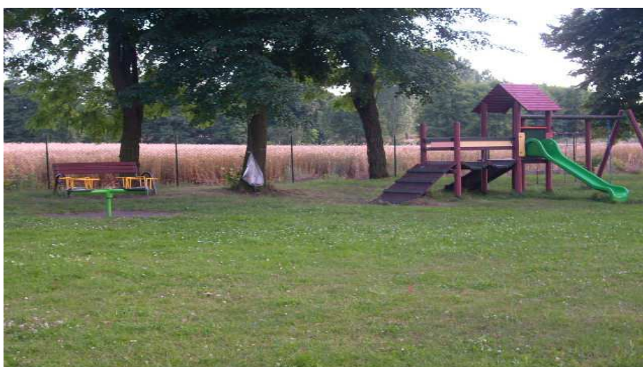
Teren przy świetlicy wraz z placem zabaw i sceną