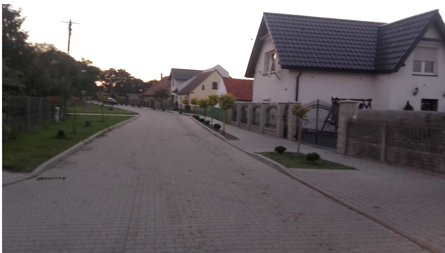
Wybudowana w 2013 roku droga z chodnikiem – obecnie ulica Nowa