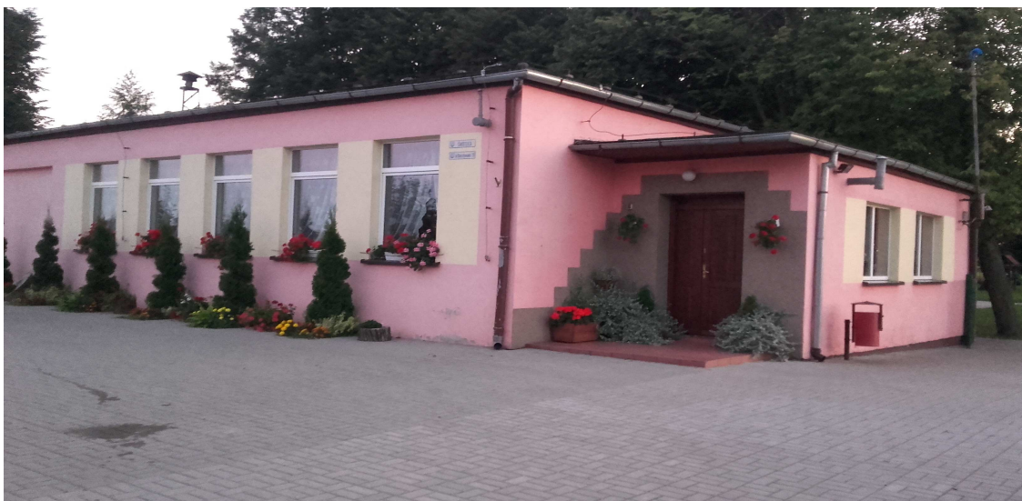
Budynek świetlicy wiejskiej